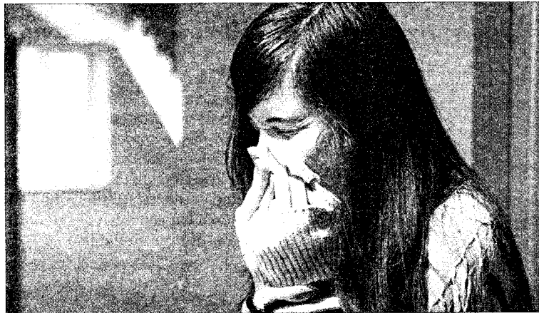
■ La alergia a los ácaros provoca rinoconjuntivitis.