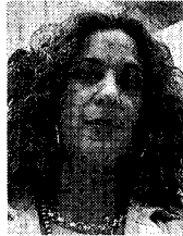
Rosario Flores La hija de Lola Flores cumple 47 años.