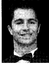
Bruno Junqueira El piloto brasileño de Fórmula 1 celebra 35 años.