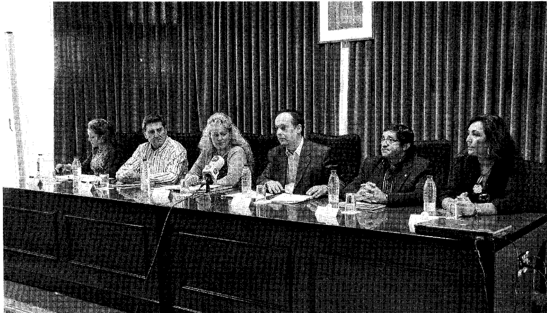
Presentación del curso para mediadores juveniles en drogodependencia.

NOVIEMBRE El Castillo de Tahal es el siguiente destino de Itinerarte 2010, una muestra que recorre varios puntos de la provincia y que exhibe las últimas tendencias artísticas creadas por jóvenes autores almerienses, de prestigio reconocido.