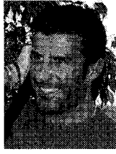
Luis Figo El ex futbolista portugués cumple 38 años.